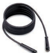
Tubi flessibili A.P. 10 m Codice TBAP 25324 (IDAC 40515 - 40616 - 40617) Codice TBAP 40009 (IDAC 40618)