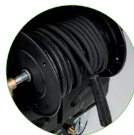
AVVOLGITUBO (optional) Codice KTRI 88654