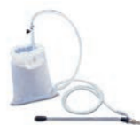
Kit sabbiante Codice LCPR 14860